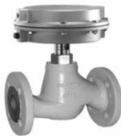
Rys. 3 · Zawór regulacyjny typu 3222/2780-1, zawór typu 3222 w wykonaniu z korpusem kołnierзовym

UWAGA: Zdjęcie poglądowe dla całej rodziny produktów.