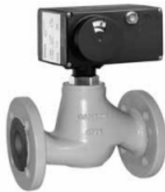
Rys. 2 · Zawór regulacyjny typu 3222/5825, zawór regulacyjny typu 3222/5725-3, zawór typu 3222 w wykonaniu z korpusem kołnierзовym