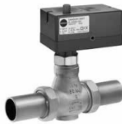
Rys. 1 · Zawór regulacyjny typu 3222/5857, zawór regulacyjny typu 3222/5757-3, zawór regulacyjny typu 3222/5757-7, z gwintem zewnętrznym i z końcówkami do spawania